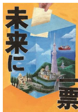
小泉 優さんの作品