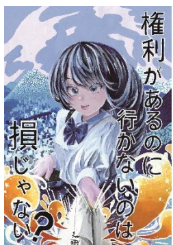
砂川 まりなさんの作品