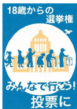
千種 桃羽さんの作品