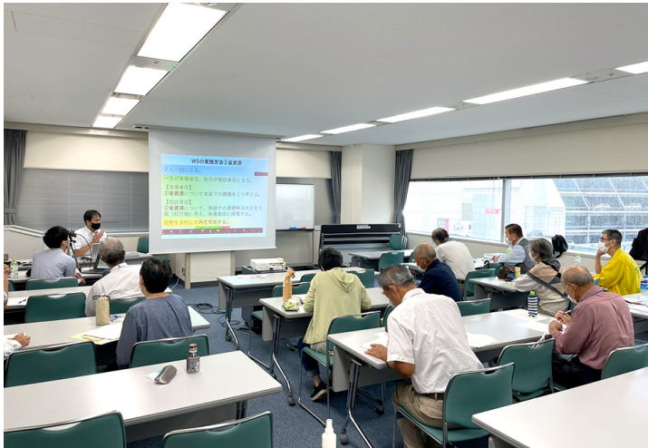
写真1-1 地球温暖化防止活動推進員研修会

地域における地球温暖化対策の普及啓発活動の中核である地球温暖化防止活動推進員*に対し、能力向上に資する研修を実施しました。各推進員は、地元市町村の環境関係のイベントなどで活動を続けており、令和4年度の延べ活動数は5,421回となりました。