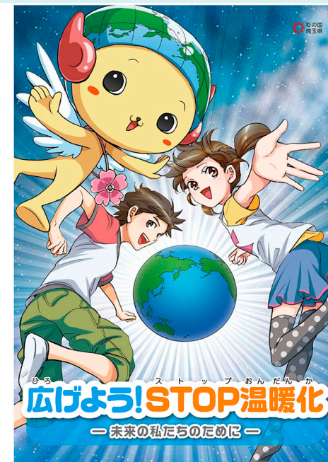
図1-3 漫画で学ぶ地球温暖化副読本