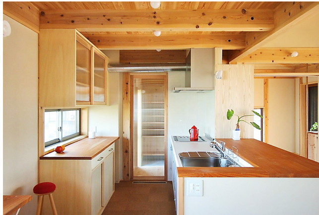
写真3-3 県産木材で建築した住宅

また、民間住宅等における利用拡大を図るため、県産木材を使用して新築・改築・内装木質化を行う住宅や事務所等に対し、県産木材の使用量に応じた助成を行いました。