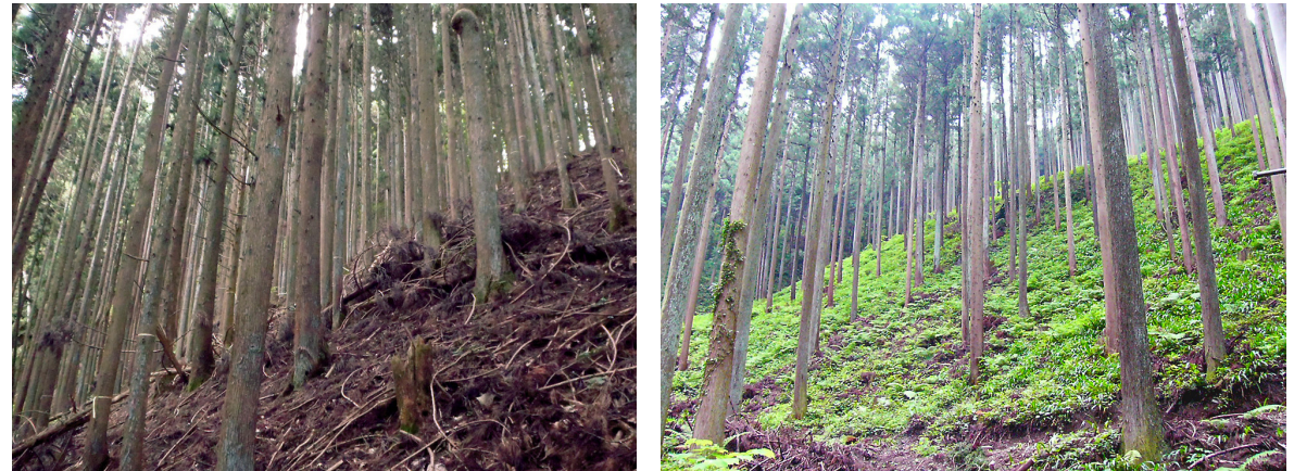
写真3-1, 3-2 森林整備施工前・後

県内の山側市町村と都市部市町との結びつきを強め、地域間連携により山側市町村において森林整備等を行い、都市部市町において山側市町村から供給される木材を利用する取組等を支援しています。