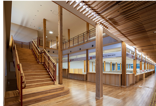
写真3-4 公共施設（小鹿野町新庁舎）