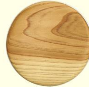
木製コースター （500円～）