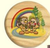
木製マグネット （全国植樹祭シンボルマーク） （600円～）