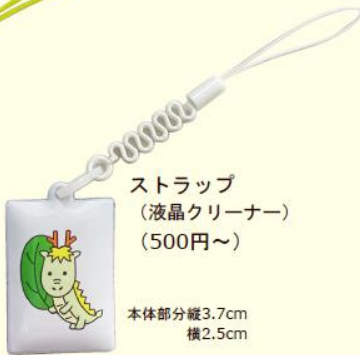
ストラップ （液晶クリーナー） （500円～）