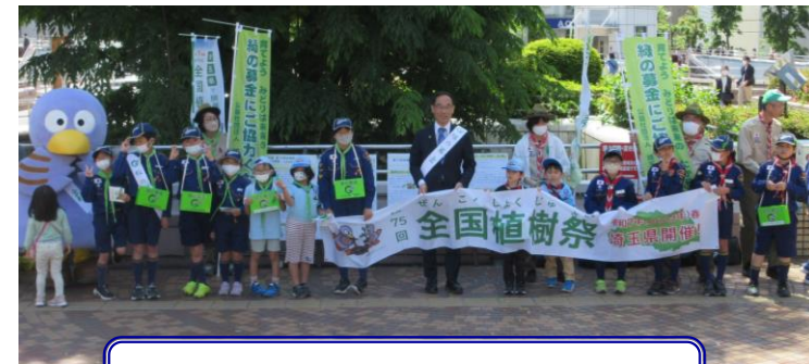
昨年の街頭募金活動