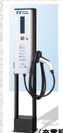
(充電設備イメージ)