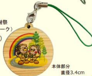
ストラップ （木製・全国植樹祭 シンボルマーク） （600円～）