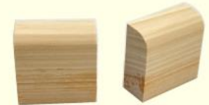
木製マグネット （無地・2個組） （700円～）