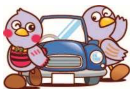
さいたまっち コバトン