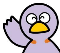
埼玉県のマスコット コバトン

画面の指示に従って、データの入力、保存、報告書の提出（電子申請）を行ってください。