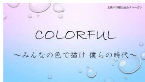
【上柴中学校生徒会スローガン】

生徒会スローガン(写真)や、各学級で話し合った内容をまとめた『上柴 OneTeam 宣言』には、そうした取組の成果が表れている。