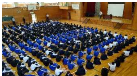
【人権週間における校長講話】

令和4・5年度は、女性(男女平等)問題への取組として、人権週間でテーマとして取り上げた他、SDGs「目標5. ジェンダー平等を実現しよう」と関連付けた取組を行った。