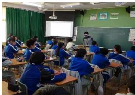
【集会後のホームルーム】

本校では、人権意識を高めるため、前期(4月)、後期(12月)に「人権週間」を設定している。シーズンごとにテーマを設定し、朝会(集会)、校長講話、人権作文、「人権感覚育成プログラム」等の内容を組み合わせ実施している。