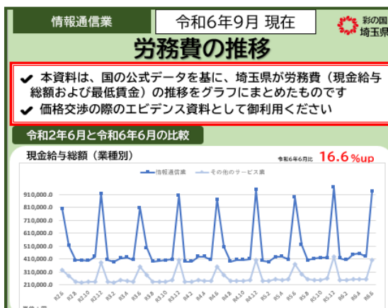
【労務費データの分析シート】