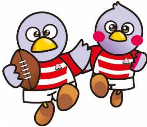
埼玉県マスコット「コバトン」「さいたまっち」