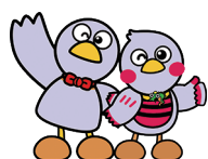
埼玉県のマスコット 「コバトン」「さいたまっちゃん」