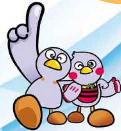
埼玉県マスコット 「コバトン&さいたまっち」