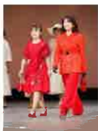
ファッションパフォーマンスショー Total Performance Show