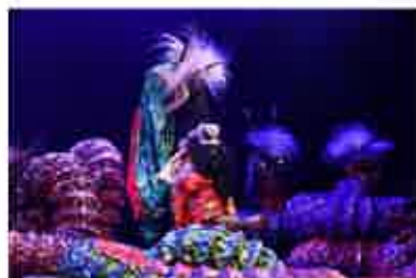
石見神楽 (桑の木神楽会) Iwami Kagura (Kuwanoki Kagurakai)