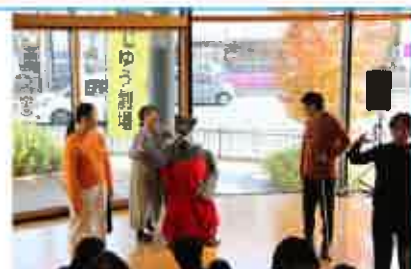
じゆう劇場 JIYU Gekijyo-Freedom Theatre

October 8 (Wed) Open Rehearsal 11:00 - Performance Times: ①13:30- ②15:30-