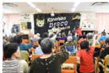
インクルーシブ・ディスコ Inclusive Disco