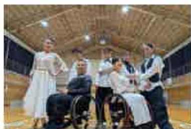
ジェネシス オブ エンターテインメント Genesis of Entertainment

鳥の劇場のプロデュースのもと、2013年に活動を開始。障がいのある人、ない人がいっしょに舞台をつくり、日常では隠れがちなそれぞれの豊かな魅力を発見し、観客と分かち合うことを目指しています。2014年「第14回全国障がい者芸術・文化祭鳥取大会」で上演。以降、鳥取県内外で毎年公演を行なう。フランス、タイでも上演。アメリカの障がいのある人の劇団や、韓国芸術総合学校との共同事業も実施。