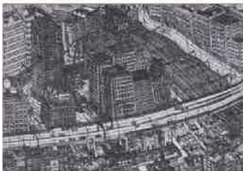
心でのぞいた僕の街 (2016) / 辻勇二 The Town I Saw with My Heart (2016) / Tsuji Yuji