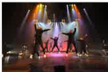
ハンドルズ×コンドルズ Handles x Condors