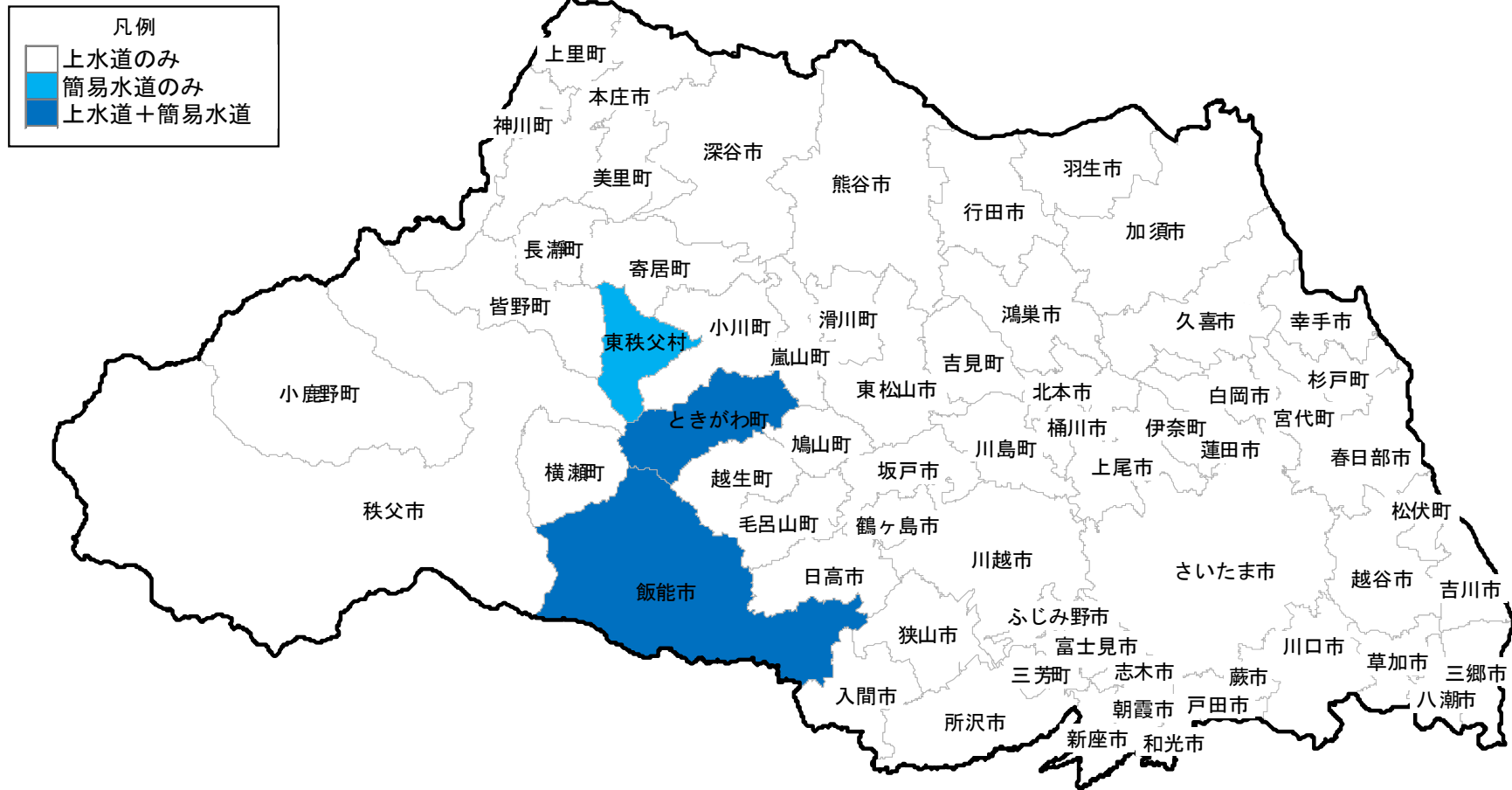
図Ⅲ－１ 市町村別水道普及状況 (2) 市町村別水道の種類