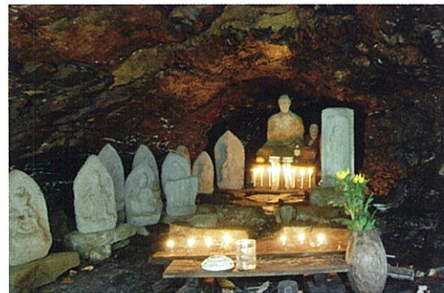
岩谷堂 江戸時代末期の仏教修行道場跡。 パワースポット。(市指定文化財)