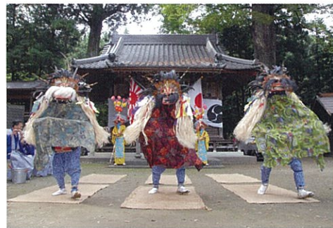
小平獅子舞 元禄年間に始められた獅子舞で、 左甚五郎伝説がある。(市指定文化財)