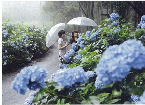
あじさいの小路 林道小平線の両側に5,500株のあじさいが 植栽されている。(平成22年度彩の国景観賞受賞)