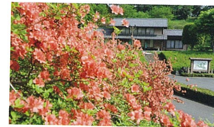
本庄市観光農業センター 小平地域の観光の核で、ふるさとの森公園内にある。