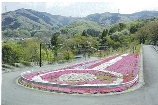
ふるさとの森公園のシバザクラ 色とりどりのシバザクラが咲き誇る。 (見頃4月中旬から5月上旬)