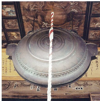
鰐口 百体観音堂の正面に吊下げられた 鰐口は寛政7年江戸の鋳物師、 西村和泉守の作で、日本一の 大鰐口といわれている。(市指定文化財)