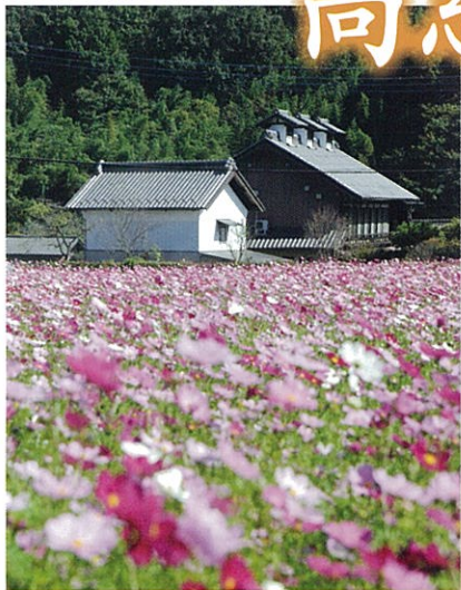
高窓の里 児玉地方の原風景。明治期に建てられた養蚕業隆盛の面影を残す。(平成20年度彩の国景観賞受賞)