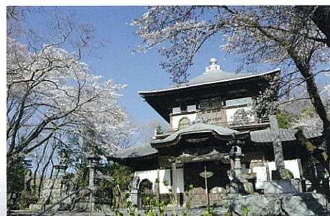
成身院百体観音堂 「さざえ堂」と呼ばれ、全国でも珍しい建築様式 をしている。児玉三十三霊場第一番札所 (本市市指定文化財)