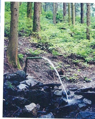
ごつくん水 広域基幹林道工事の時、湧きでた水を昭和62年に整備し、埼玉県の名水。

伝統文化が息づき ふるさとの郷愁が漂い 人と自然が共生する小平 高窓の里 日本の原風景に 会いに来てみませんか