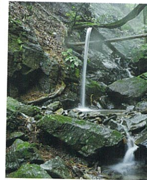
不動滝 小平川上流のある滝で、丸太に溝を掘った「かけい」で流れを導き、落差2、5メートル。