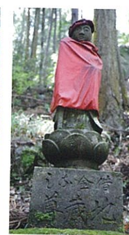
借金なし地藏尊 借金が返済できたお礼に昭和7年に建立された。ご利益のある地藏尊。