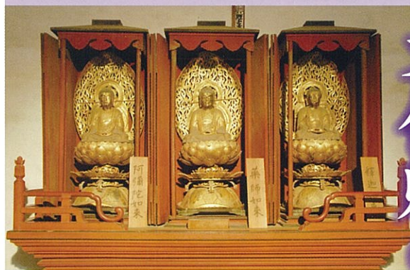
成身院の三仏 木造の阿弥陀・薬師・釈迦如来坐像で 室町時代の作。(市指定文化財)