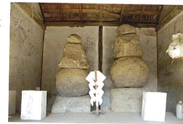
ほてい堂 根岸郭の人達により、ほてい様だと守り伝えられている二基の五輪塔。(市指定文化財)