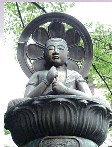
唐銅造大日如来座像 郷土の金屋鋳物師、倉林治兵衛国義 作である。(市指定文化財)