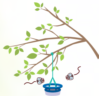
フェロモン剤による誘引