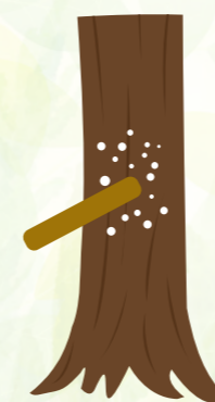
掻き落としによるカイガラムシ等の駆除

害虫の捕殺や被害を受けた部分の除去などを優先し、やむを得ない場合にのみ、農薬による防除を行いましょう。