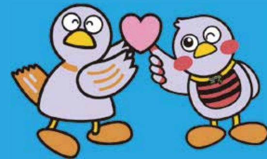
埼玉県マスコット「コバトン」「さいたまっち」

埼玉県では、すべての市町村が骨髄又は末梢血幹細胞を提供した方への助成制度をつくり、全県を挙げて、命を救いたいという県民の善意の気持ちを応援しています。