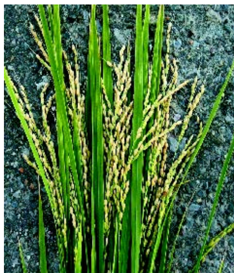
▲ 収穫適期の穂の様子