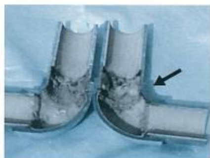
古い給水管例

一時的に着色する場合には飲用以外の用途に使用しましょう。ひどい時には「配管替え」「パイプライニング」などの対策があります。