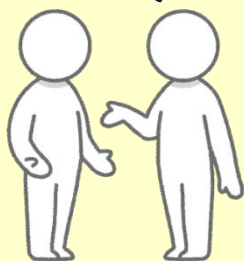
上司や取引先 被告B

上司である被告Bは、部下である原告Aについて、異性関係が派手である等の噂を長期間にわたり、社内外の関係者に流すなどした。原告Aは、会社に対し救済を求めるも、適切な処置をとらず、逆に、原告が女性であることの一事をもって原告のみに退職を強要した。原告は、閉鎖的な精神状態に追い込まれ退職を余儀なくされた。