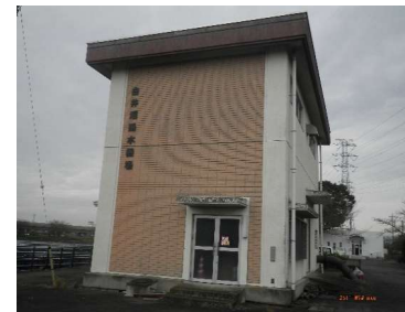
白井沼揚水機場 建屋