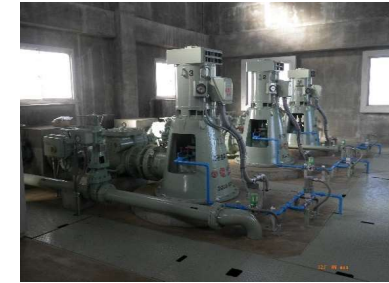
梅ノ木・古凍揚水機場 ポンプ設備