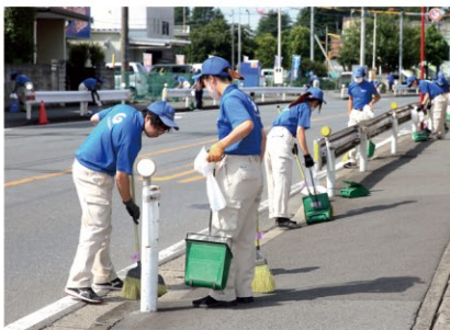
【清掃美化活動の状況】