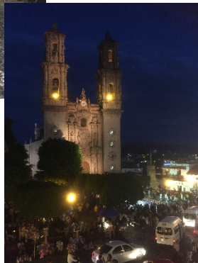
〔(右)中央にある教会〕