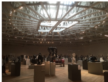
〔ソウマヤ美術館の外と中〕

また私が通う大学、UNAMのキャンパスは広大なのですが、その中にあるのが現代アート美術館です。企画展や現代アート作品が数多く展示され、こちらも学生は無料で訪れることができます。