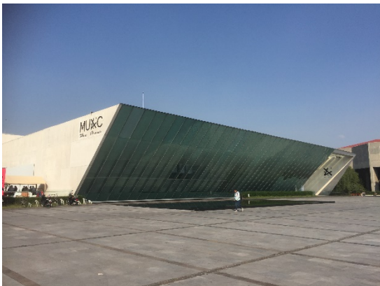
〔現代アート美術館〕

また私が通う大学、UNAMのキャンパスは広大なのですが、その中にあるのが現代アート美術館です。企画展や現代アート作品が数多く展示され、こちらも学生は無料で訪れることができます。