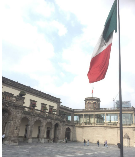
〔古城を利用したチャプルテペック美術館〕