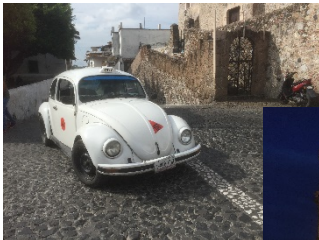
〔(上)ビートルタクシー〕

タスコは坂の街で、小回りの効くフォルクスワーゲンのビートルが市民のタクシーとして大活躍しています。