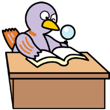
埼玉県のマスコット コバトン