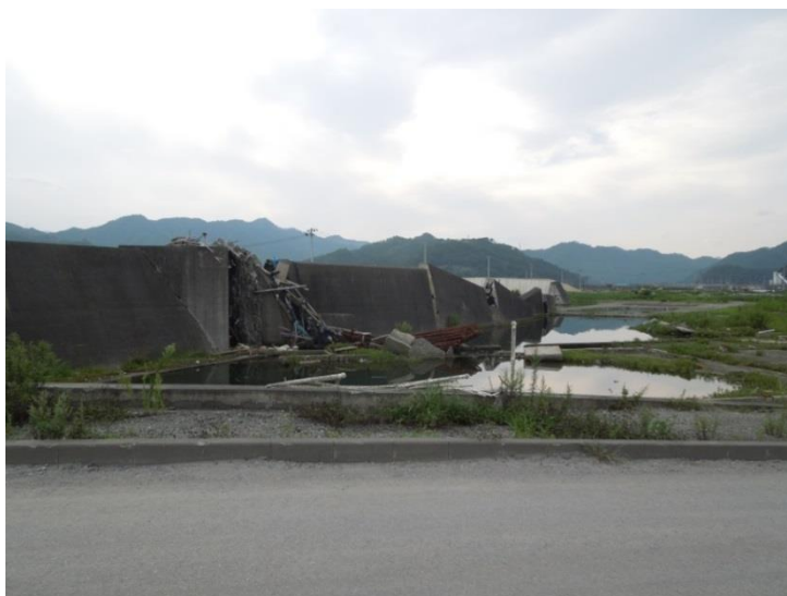
被災したままの防潮堤