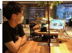
分身ロボット「OriHime」での接客イメージ