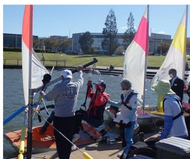
川の国応援団の取組を支援する 企業サポーター