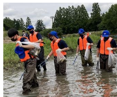
川の国応援団・個人サポーター による河川の清掃活動