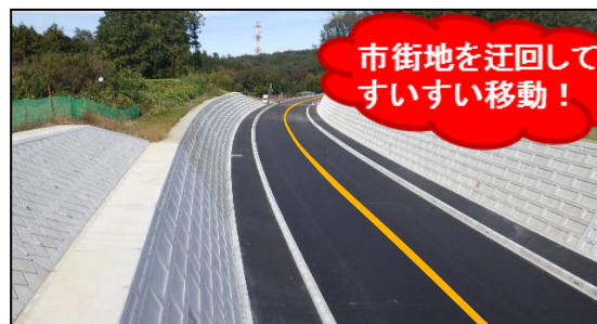
②整備状況 (バイパスルート)