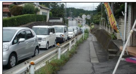
①整備前 (現道ルート)