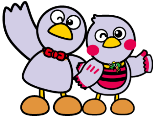
埼玉県マスコット 「コバトン」と「さいたまっち」