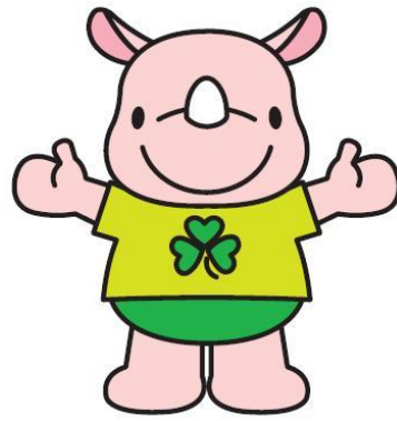
彩の国コミュニティ協議会マスコット 「サイコミ君」

私たちは彩の国コミュニティ協議会の企業会員として、県内のコミュニティ活動を支援しています。（34社）