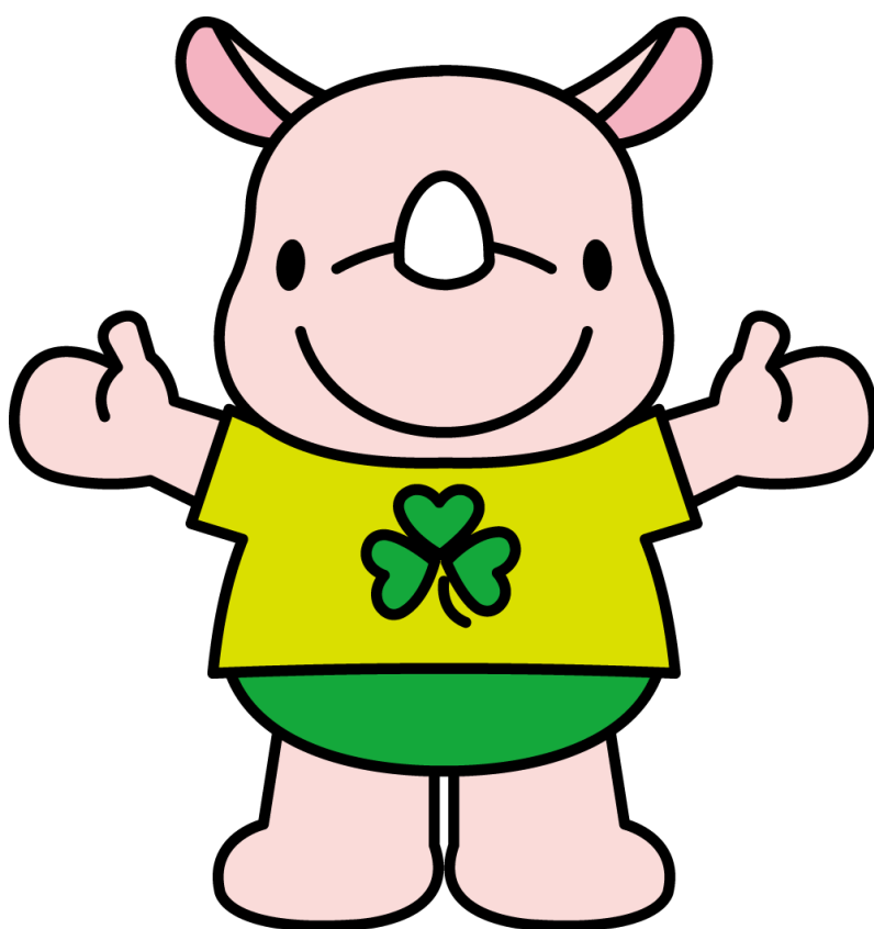
彩の国コミュニティ協議会 マスコット「サイコミ君」

日時 令和5年6月7日（水） 14時00分 会場 さいたま商工会議所会館 第1・2ホール