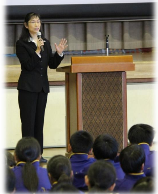
スキーインストラクターに学ぶ「働く喜び」