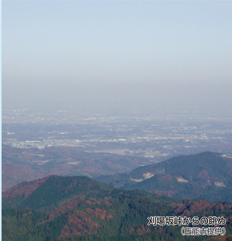
刈場坂峠からの眺め