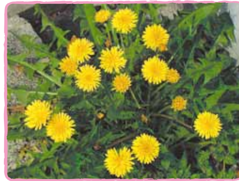
カントウタンポポ