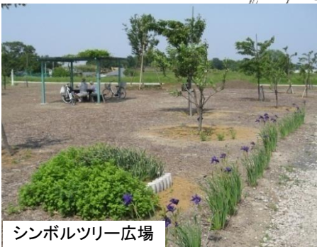
シンボルツリー広場