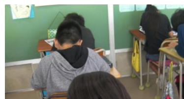
朝の学力アップ教室

本校では、平成21年度から7年間、国語科を中心に校内研修を行った。様々な取組の中、短作文を書く活動を継続してきた。また、群読集会についても継続して行い、それに向け、毎朝各学級で大きな声で群読練習をした。また、全校で「多読書賞」の表彰やボランティアによる読み聞かせ等、読書活動にも力を入れてきた。さらに、全校児童が作成した「言葉のミュージアム」（ことわざ・慣用句等）という掲示物の作成、掲示も行った。