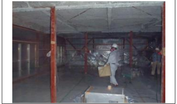
撤去前の状況全景2