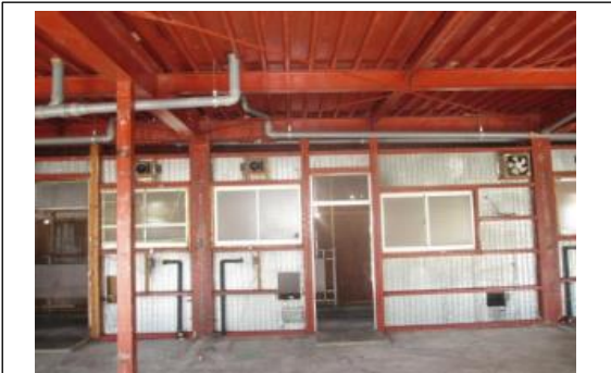
撤去後の状況全景1