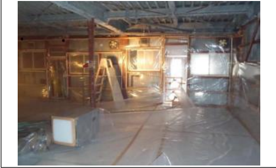
撤去前の状況全景1