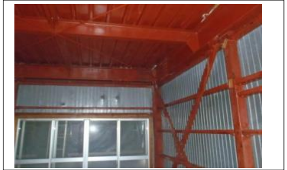
石綿除去細部の状況2