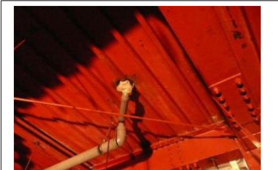
石綿除去細部の状況3