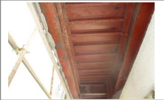
石綿除去細部の状況1