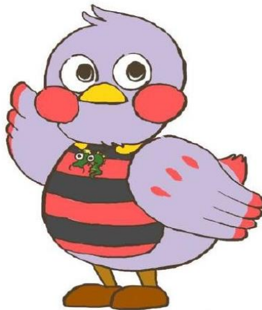
埼玉県マスコット さいたままっち