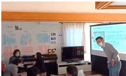
【空き家の現状と再生事例】

⑤11/13(土)14時～16時 シェアハウス結 空き家と高齢者賃貸事情のセミナー 中高年齢層 17人