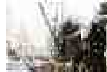
道路閉塞等の発生