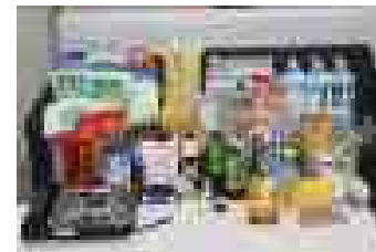
【参考】備蓄ユニット