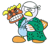
埼玉県のマスコット コバトン