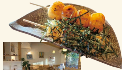
焼きだんご 2本 250円