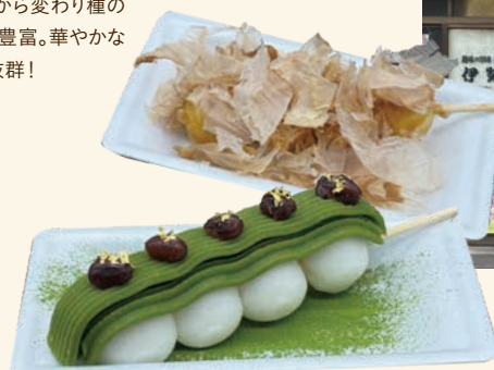
BUSHIだんご130円(上) 河越抹茶あんだんご250円(下)