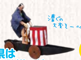
漕ぐの大変とーっ