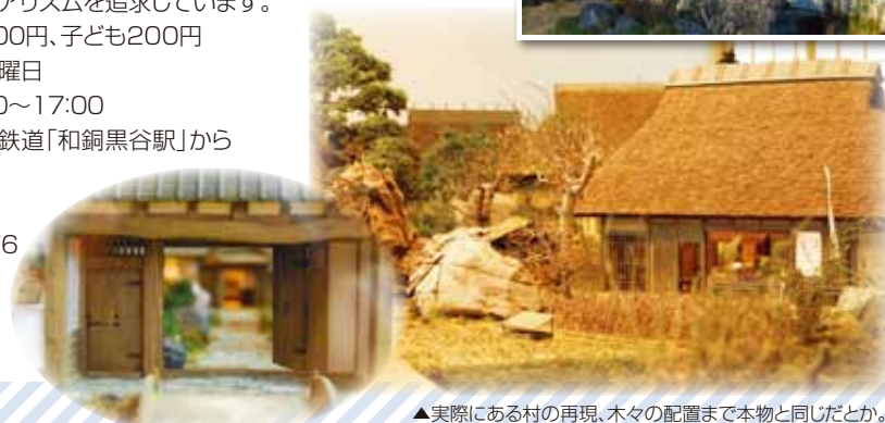
▲実際にある村の再現、木々の配置まで本物と同じだとか。