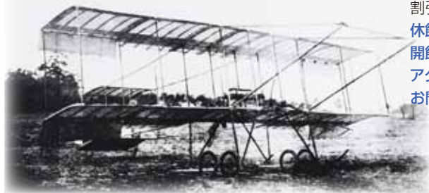
▲アン1・ファルマン機