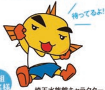
5組 10名様 埼玉水族館キャラクター 「ムート」くん