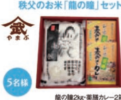
5名様 龍の瞳2kg・薬膳カレー2箱

C 健康に良い「薬膳カレー」と 日本の美味しいお米を目指す 秩父のお米「龍の瞳」セット