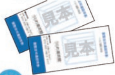
5組 10名様 どの企画展にも利用可能です。 ご来場の際は、予め会期をご確 認の上、お越し下さい。

C 健康に良い「薬膳カレー」と 日本の美味しいお米を目指す 秩父のお米「龍の瞳」セット