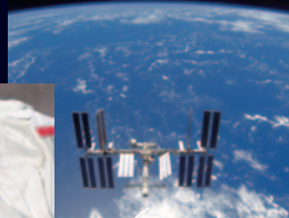
若田さんが滞在予定のISS。次はなんと4度目の宇宙滞在!

若田さんの最新情報はJAXAホームページもしくは、若田さんのTwitterアカウント@Astrō_Wakataをフォローしよう!