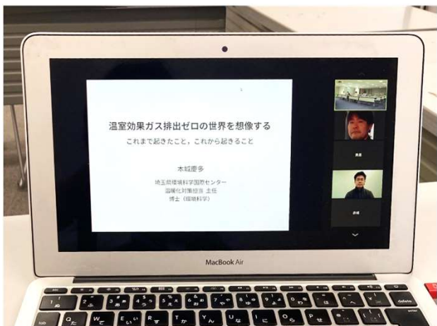
オンラインでの開催も ※担当課にご相談ください

埼玉県が取り組む事業や施策 を県職員が説明します。 集会や団体の会議、学校の授 業などにご活用ください。