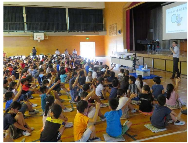
学校や職場にも出前します