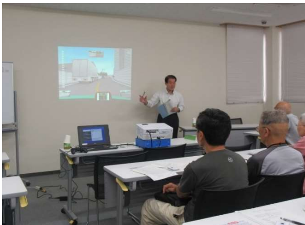
PTA や地域での勉強会などに