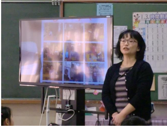
【 本時の活動のめあての確認 】