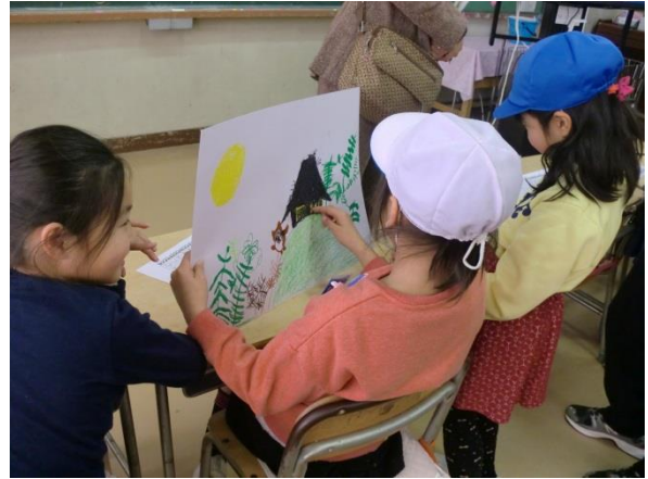
【3人グループでの練習・交流活動の充実】