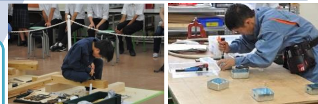
ものづくりコンテスト

【希望進路の実現】 ・進路決定100% ・多様な選択科目から進路実現 ・課題研究等で専門技術の深化