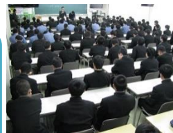
電気工事士の朝補習

【学力向上】 ・専門知識・技術の向上 ・国家資格取得やコンテストに挑戦 ・部活動や学校行事で心を育む