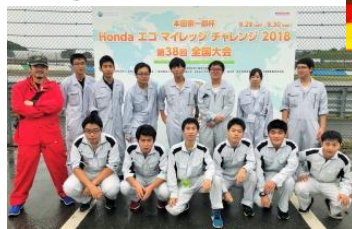
エコカーコンテスト 機械研究部