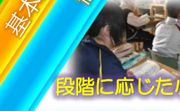
段階に応じた小集団学習・個別学習