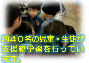
約40名の児童・生徒が支援籍学習を行っています。