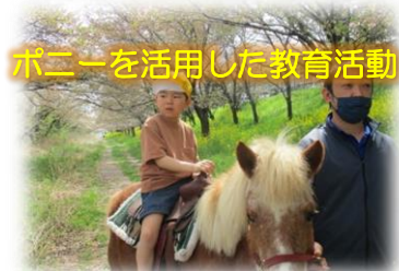
ポニーを活用した教育活動