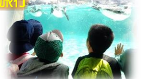
感動を共有する学校行事