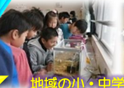
地域の小・中学校との交流会