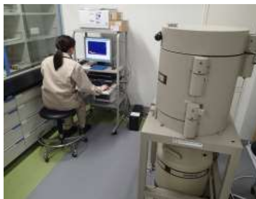
ゲルマニウム半導体検出器 (放射性物質の測定)

東京電力株式会社福島第一原子力発電所の事故に伴い、放出された放射性セシウム等による水道水への影響を監視するため、浄水場の原水及び浄水の検査を行います。行田浄水場の原水を週に1回、各浄水場の浄水を月に1回検査します。