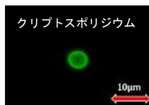
落射蛍光観察画像