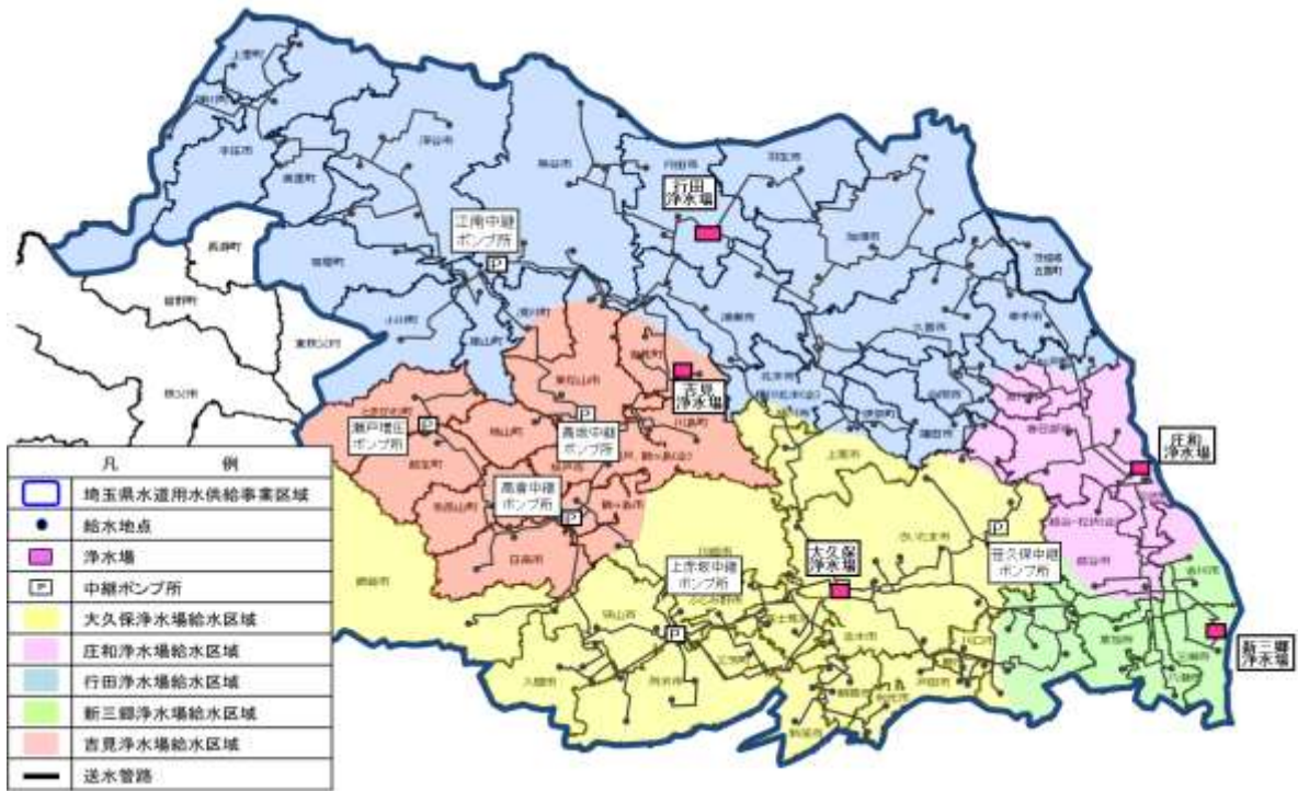
図2 各浄水場の給水区域