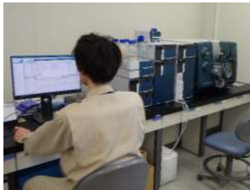
液体クロマトグラフ質量分析計 (ハロ酢酸類等の測定)