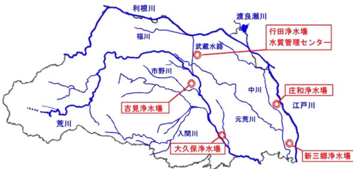
図1 県内を流れる主な河川と浄水場の位置