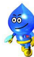
埼玉県営水道マスコット 「ウォー太郎」