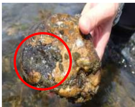
かび臭物質を産生する藻類の一種

※4 ハロ酢酸類とは、水中の有機物と消毒のために注入する塩素が反応してできる、クロロ酢酸等3物質の総称です。