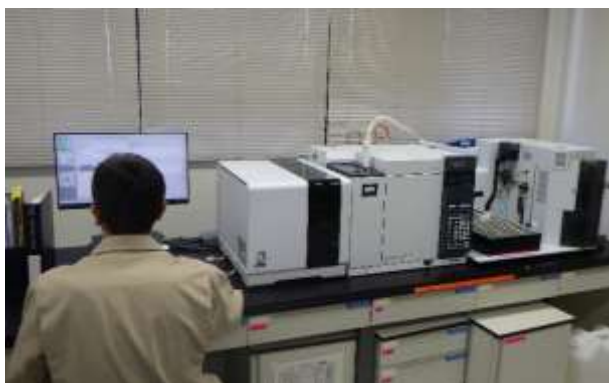
ページ・トラップーガスクロマトグラフィー質量分析計 （かび臭物質の測定）

法令での義務付けはありませんが、検査することが望ましいとされている項目について行う検査です。送水系統ごとに選定した給水地点、浄水場の原水及び浄水で検査を行います。検査地点は表4、検査項目・頻度は表7、農薬類の内訳は表8のとおりです。