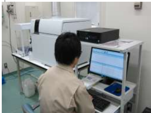
誘導結合プラズマ質量分析計 (金属類の測定)