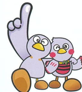
コバトン さいたまっち