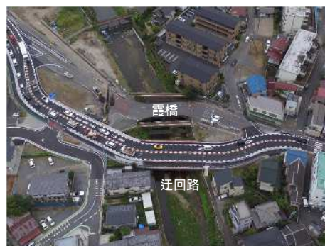
橋りょう架換え工事 国道299号（霞橋）

3 予算額 14,532,193千円（2月補正との合計で17,044,647千円）